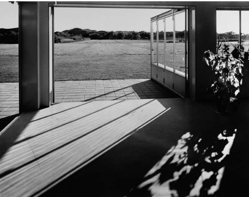
Eva Besnyö Zomerhuis te Groet, 1934, barietdruk/gelatin silver print

Eva Besnyö - 2,3 | Carlijn Mens - 4,5 | Ko Oosterkerk - 6,7 | New Media New Forms - 1,8 | Agenda - 8