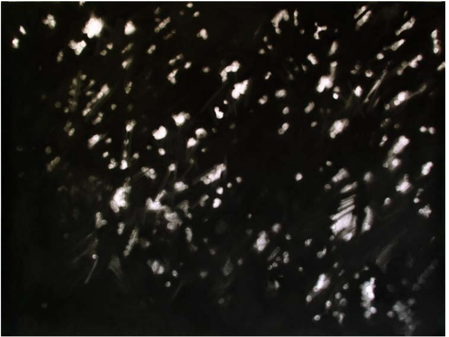
Carlijn Mens Trees , 2009, houtskool/charcoal op papier, 196 x 255 cm

Met houtskool probeert Mens het dagelijkse licht in een ruimte of op een buitenplaats te vangen. Licht, een eeuwenoud en primair beeld element in de kunst. Vermeer, Rembrandt, Constable, Turner en Van Gogh verbeelden allen het licht op een eigen wijze. De uitvinding en opkomst van de fotografie halverwege de negentiende eeuw heeft de manier van uitbeelden van het licht ook beïnvloed. De registratie van het licht in fotografische beelden heeft het zien ingrijpend veranderd. De veranderlijkheid van het licht in al zijn nuancerings is door de fotografie goed zichtbaar gemaakt. Carlijn Mens probeert diezelfde veranderlijkheid van licht te vangen in haar soms kleine, soms immens grote tekeningen. Als een impressionist maakt ze haar werk vaak op locatie, ter plekke gebruikmakend van zonnestralen die met de bomen schaduw creëren op de weg. Of in een loods, waar het licht