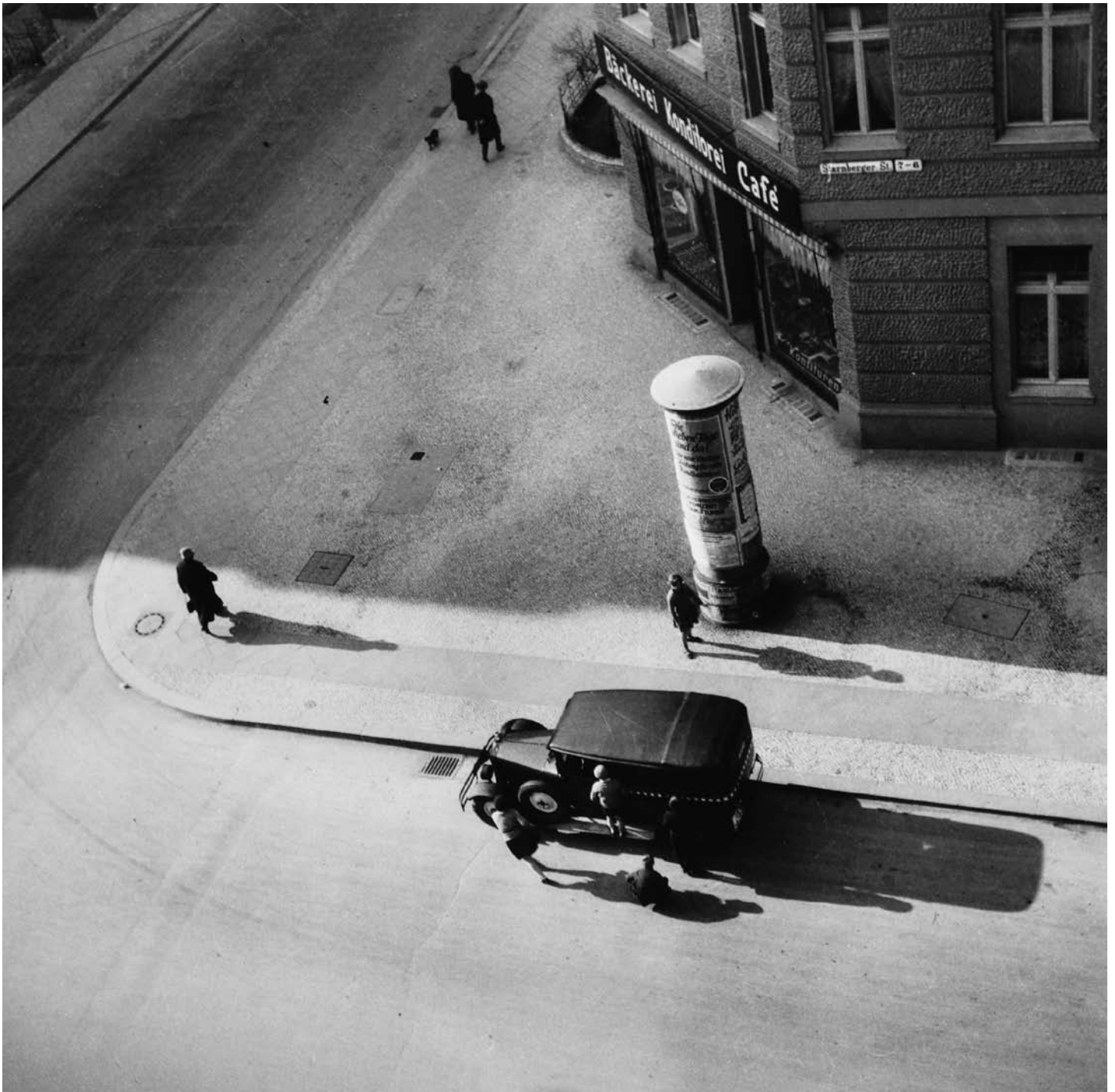
Eva Besnyö Berlin, 1931, barietdruk/gelatin silver print