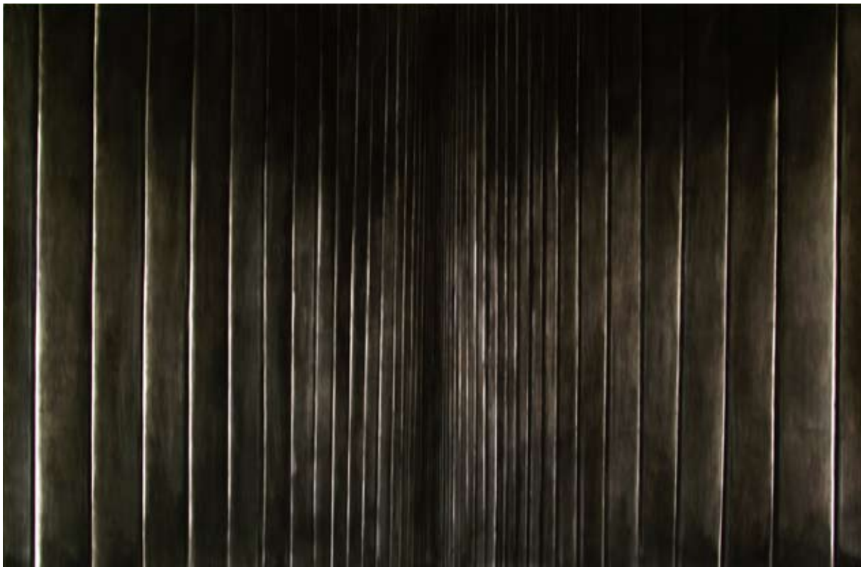
Carlijn Mens Surface-2 , 2008, houtskool op papier/charcoal on paper, 196 x 292 cm (2 delen)

Voor de manifestatie Art for Sail Amsterdam in 2005 maakt Mens in een grote stalen container een driedimensionale tekening waar ze met het zwart van houtskool licht creëert. Het binnenste van de container is intens zwart, waarbij je wordt aange-trokken door de enige bron van licht dat komt uit een patrijspoort. Surface-2 komt voort uit deze manifestatie en is een weergave van een containerwand. Er lijken verschillende tonen zwart te zijn aangebracht, maar het kleine beetje wit dat Mens heeft overgelaten tussen de zwarte lijnen, zet je op het verkeerde been en geeft een vervreemdend effect. Het donker slokt je op, je lijkt in de wand te worden gezogen.