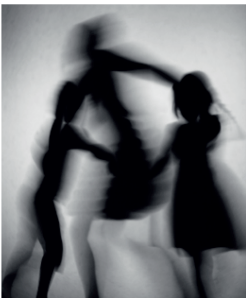
DANS, 2013, ARCHIVAL PIGMENT PRINT COVER TOP: PRESERVED PLACES, SCHOORL, 2014 ACRYLIC AND OIL ON LINEN (DETAIL)