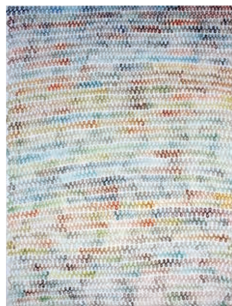
COLORLED PRETEXT, 2014, OIL ON CANVAS

MARKER ON PAPER BAG, 40 X 50 CM (DETAIL)