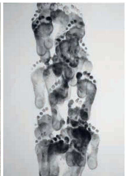
L'HUMAIN LAISSE UNE TRACE DE SENS, 2013 CHARCOAL ON PAPER, 61 X 42 CM