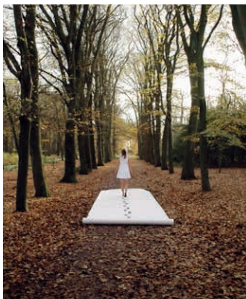
I WALK, THEREFORE I AM, DRAWING AS A PERFORMANCE, PHOTO PRINT HAHNEMUHLE MUSEUM ETCHING, 60 X 45 CM