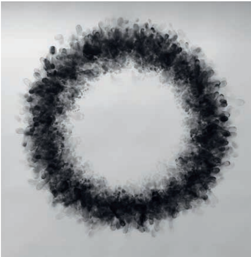
CARLIJN MENS DANSA I EN RING, 2013, CHARCOAL ON PAPER, 200 X 200 CM